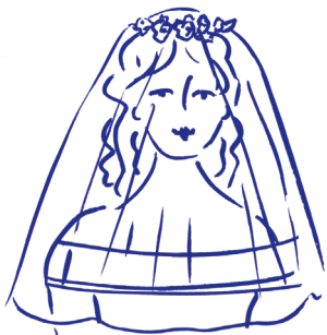
welon w stylu „blusher”