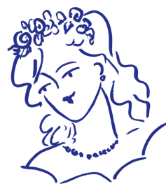
wianek z kwiatów

Kokardy, opaski, diademy, stroiki i wianki nosi się z welonem lub bez niego. Kapelusze i opaski, z woalką lub same, stanowią atrakcyjne akcesoria dla strojów nieformalnych, takich jak kostium ślubny.