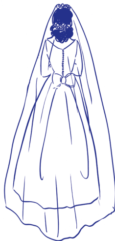
welon w stylu „chapel”