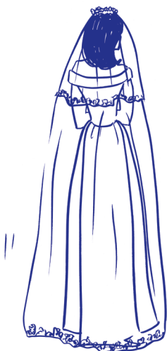
welon w stylu „sweep”