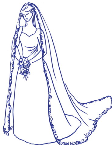
welon w stylu „cathedral”

Kokardy, opaski, diademy, stroiki i wianki nosi się z welonem lub bez niego. Kapelusze i opaski, z woalką lub same, stanowią atrakcyjne akcesoria dla strojów nieformalnych, takich jak kostium ślubny.